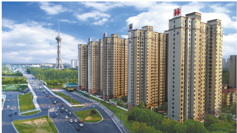
干净整洁的周口大道