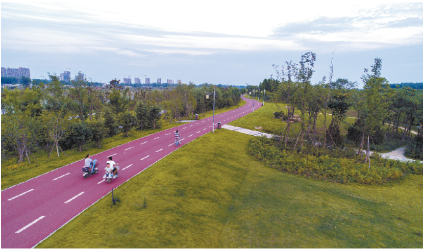
美丽的沙颍河生态廊道