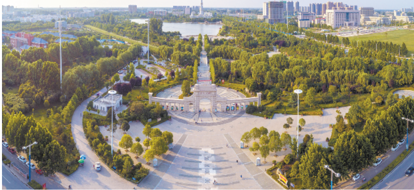
环境优美的周口公园