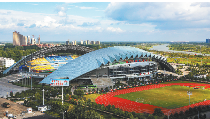
壮观大气的周口市体育中心