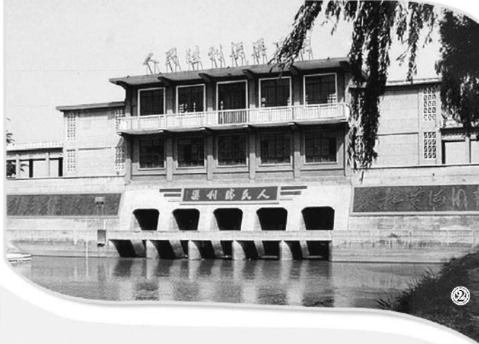
图① 碓是砸地基或打桩等用的一种工具。武陟悠久的治黄历史孕育了制碓、打碓等丰富多彩的碓文化,展现了人民团结协作与自然抗争的精神。(资料图片)