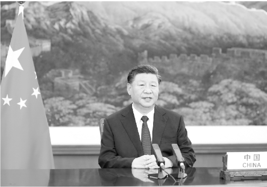
9 月 21 日,国家主席习近平在联合国成立 75 周年纪念峰会上发表重要讲话。

习近平强调,当今世界正经历百年未有之大变局,突如其来的新冠肺炎疫情对全世界是一次严峻考验。人类已经进入互联互通的新时代,各国利益休戚