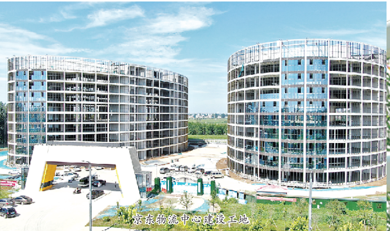
临港物流中心建设平地