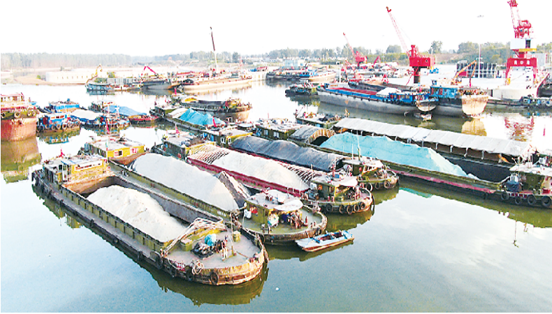
沙颍河航道上桅杆云集