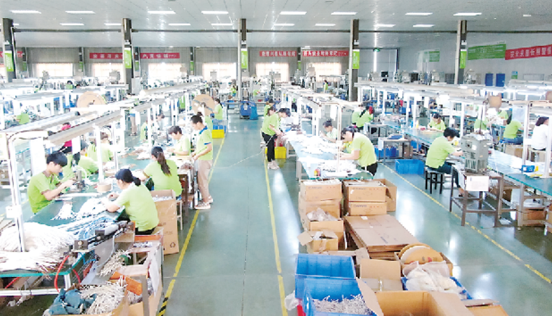
港区企业生产车间一派繁忙