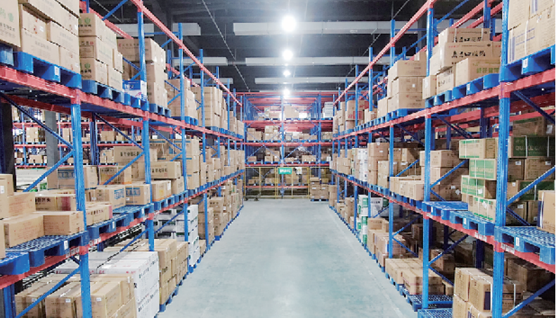
港区一家企业的智能化仓储物流中心