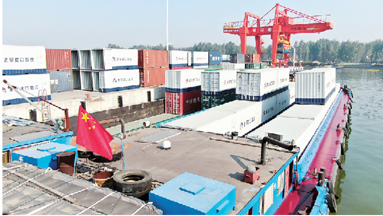
集装箱船整装待发