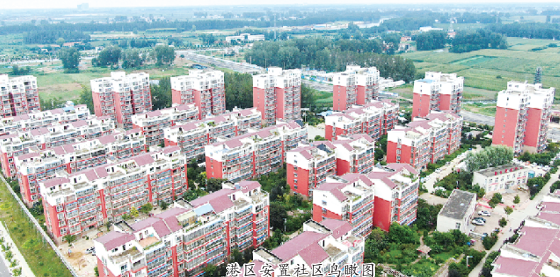
港区安置社区的鸟瞰图

近年来,周口市借助拥有全省唯一通江达海的内河航运优势,以大力发展临港经济为突破口,推动由“黄土地经济”向“蓝色经济”转型,打造“豫货出海口”。作为当地发展临港经济的主阵地,周口港区着力打造多式联运枢纽,完善临港产业布局,持续优化营商环境,助推临港经济高质量发展,在砥砺前行奋进中,开创中原港城建设新局面。