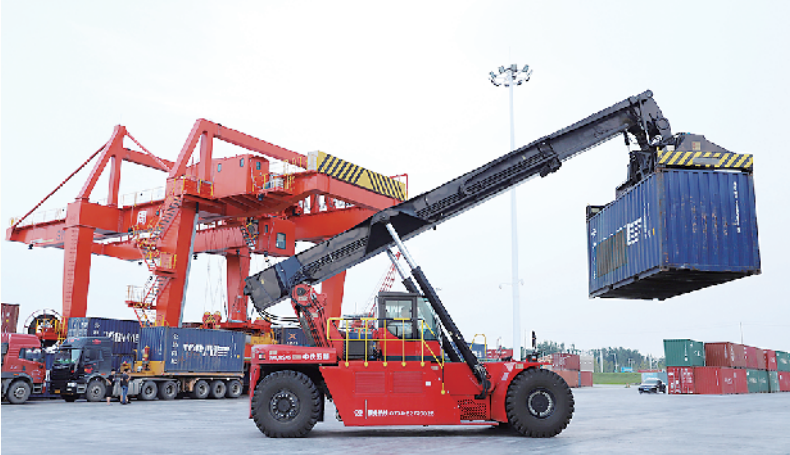
码头上的集装箱正面吊作业现场