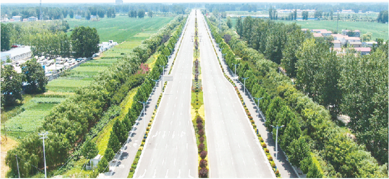
港区道路宽阔整洁