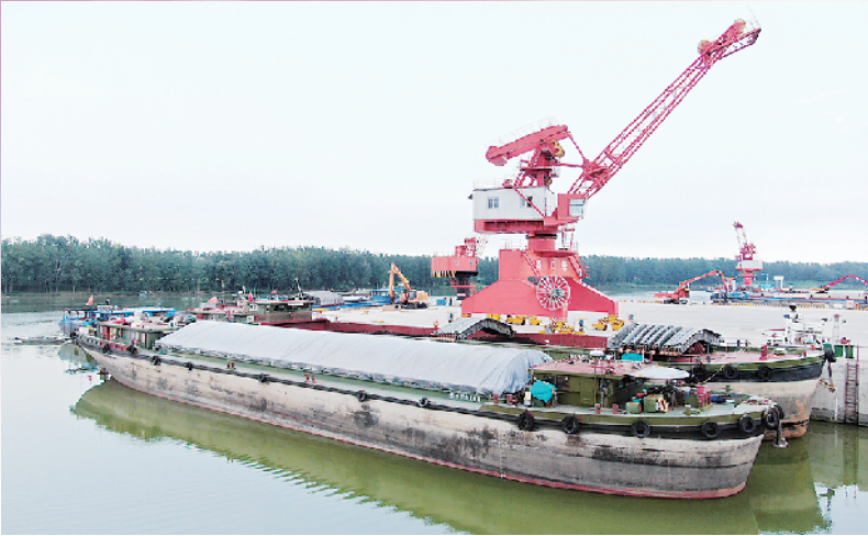
货船停靠在挖入式港池内