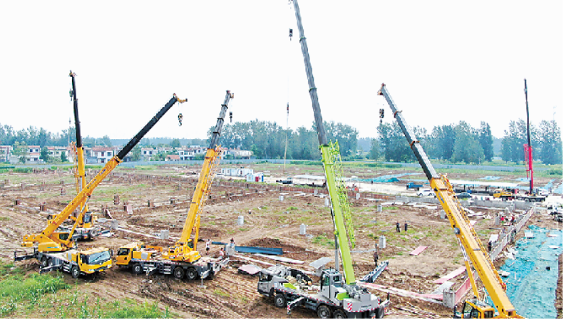
中心港码头仓储物流园区建设热火朝天