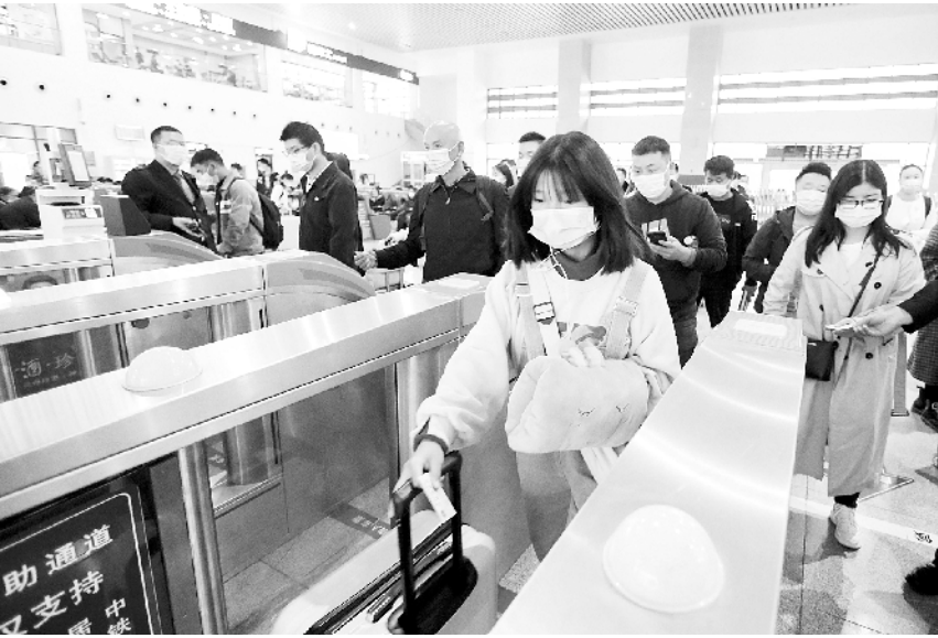
多地迎来节日返程客流高峰

据介绍，本次活动由中国宋庆龄基金会、中国福利会、国家大剧院共同主办。为让更多青少年儿童共同参与到此次祝福祖国的活动中来，10月10日晚，主办方还将对主题演出盛况进行网络高清线上播出，国家大剧院古典音乐频道等多家网络平台同步视频播，邀请观众在线观看。