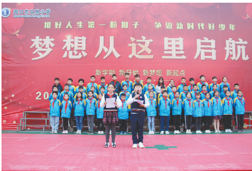
10月13日,是中国少年先锋队诞辰日,又称少先队建队纪念日。周口市文昌小学坚持以立德树人,把课堂教学与主题活动相结合,开展了多种多样的“国旗下成长”主题教育活动。图为在10月12日的升旗仪式上,六(4)中队少先队员向全校学生普及红领巾知识。