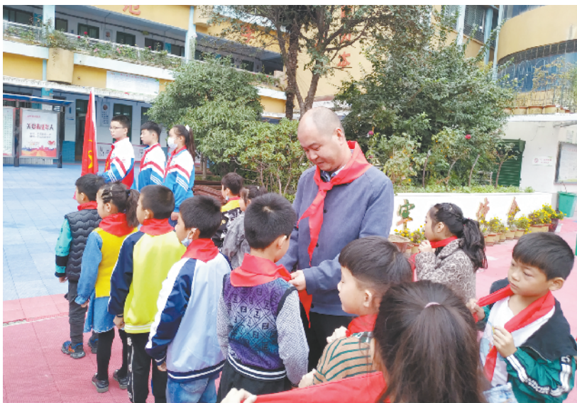
在中国少年先锋队第71个建队日到来之际,为增强学校少先队组织力量,引导广大队员继承和弘扬少先队的光荣传统,10月12日,周口市回庄小学举行了“争做新时代好队员”主题升旗暨入队仪式。仪式上,该校120名新队员如愿戴上了鲜艳的红领巾。