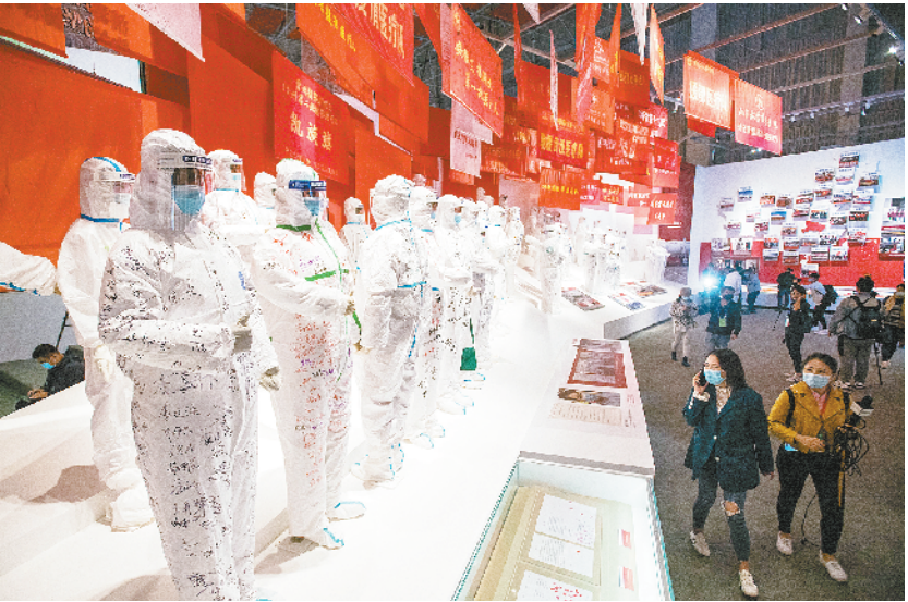
“人民至上 生命至上”抗击新冠肺炎疫情专题展览开幕 10 月 15 日，人们在抗击新冠肺炎疫情专题展览上参观。当日，“人民至上 生命至上”抗击新冠肺炎疫情专题展览开幕式在湖北省武汉市举行。

新华社北京 10 月 15 日电 10 月 16 日出版的第 20 期《求是》杂志将发表中共中央总书记、国家主席、中央军委主席习近平的重要文章《在全国抗击新冠肺炎疫情表彰大会上的讲话》。 文章强调，抗击新冠肺炎疫情斗争取得重大战略成果，充分展现了中国共产党领导和我国社会主义制度的显著优势，充分展现了中国人民和中华民族的伟大力量，充分展现了中华文明的深厚底蕴，充分展现了中国负责任大国的自觉担当，极大增强了全党全国各族人民的自信心和自豪感、凝聚力和向心力，必将激励我们在新时代新征程上披荆斩棘、奋勇前进。 文章指出，在这场同严重疫情的殊死较量中，中国人民和中华民族以敢于斗争、敢于胜利的大无畏气概，铸就了生命至上、举国同心、舍生忘死、尊重科学、命运与共的伟大抗疫精神。伟大抗疫精神，同中华民族长期形成的特质禀赋和文化基因一脉相承，是爱国主义、集体主义、社会主义精神的传承和发