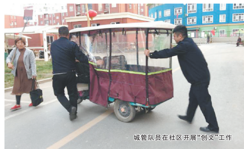
城管队员在社区开展“创文”工作

本报讯(记者宋凤文/图)为迎接全国文明城市提名城市测评工作,港区域管办严格按照港区党委、港区管委会部署,认真落实市城管办督查通报问题,坚持全体人员一线上岗,坚持发现问题立即整改,坚持顾全大局主动认领任务,斗志昂扬、精心安排、用心落实,全力以赴打赢创建全国文明城市提名城市攻坚战。