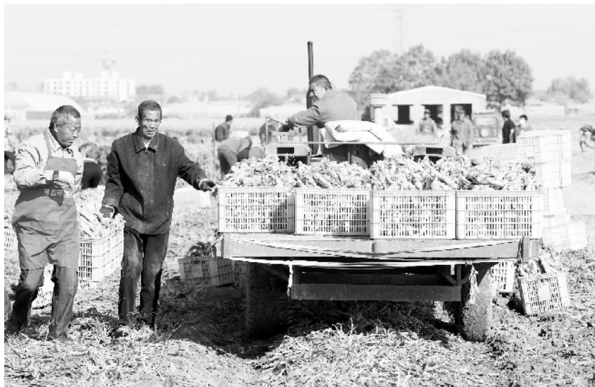
河北赵县:生姜收获忙 11 月 3 日,在河北省赵县韩村镇,赵县天舟农作物种植专业合作社的农民将生姜装车运输。近日,河北省石家庄市赵县韩村镇种植的生姜进入成熟收获期,当地村民在田地里起姜、拾筐、装车,一派繁忙景象。近年来,河北省赵县结合市场需求,引导农民种植生姜近 2000 亩,拓宽农民的致富渠道。

新华社北京 11 月 4 日电(记者 奥曦)记者从中国铁建股份有限公司获悉,4 日,由中铁十四局承建的我国最大跨度钢箱梁转体桥顺利完成转体施工,为青岛新机场高速连接线工程的全线贯通打下坚实基础。 据中铁十四局施工现场负责人张子杰介绍,青岛新机场高速连接线转体桥设计结构为 240 米 T 型钢箱梁,左右错幅布置,双幅桥面总宽 49.16 米,总重量达 1.9 万吨,是目前我国最大跨度钢箱梁转体桥。此次转体施工为双幅同步逆时针转体,历时 90 分钟平转 90 度后精准就位。 与普通桥梁相比,青岛新机场高速连接线转体桥采用了耐候钢全焊接免涂装技术,可以实现一百年全寿命周期内免涂装,有效避免后期桥梁经常性维修保养对铁路运营造成的影响,同时大大降低了桥梁的维修保养成本。