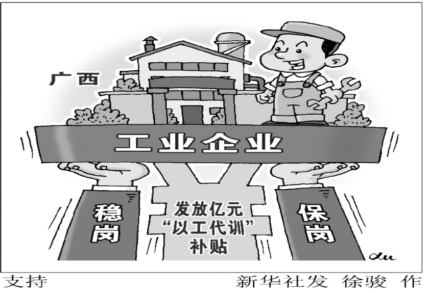
支持 新华社发 徐俊 作