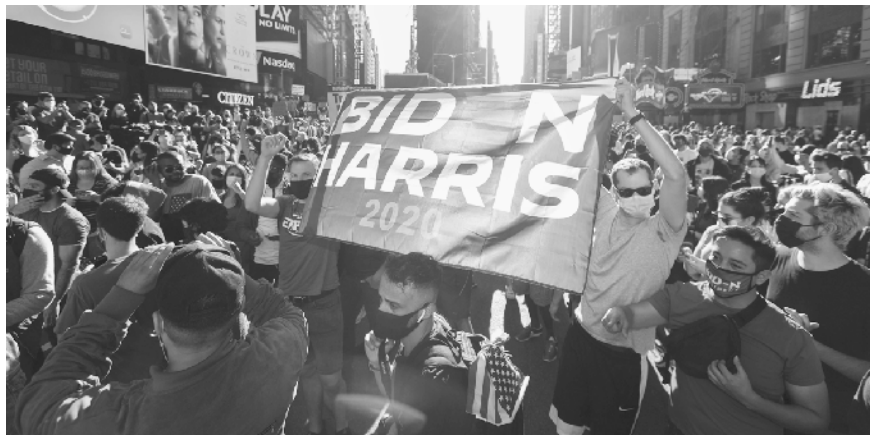
11月7日，人们聚集在美国纽约时报广场。据美国媒体7日测算，民主党总统候选人、前副总统拜登在2020年美国总统选举中已获得超过270张选举人票。共和党总统候选人、现任总统特朗普随后表示，此次选举远未结束。针对选情最新变化，美国多地有拜登的支持者上街庆祝，也有特朗普的支持者上街抗议。