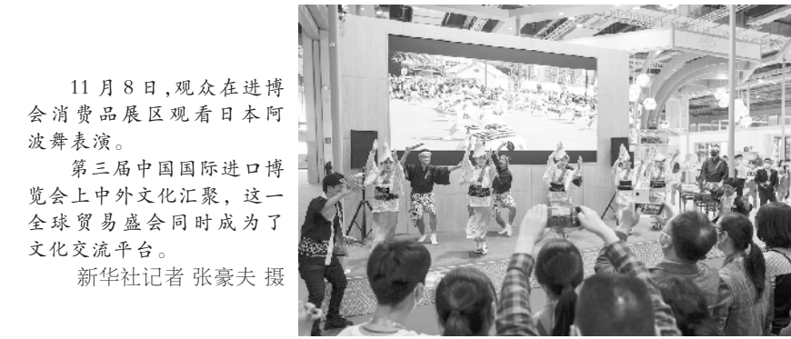
11月8日，观众在进博会消费品展区观看日本阿波舞表演。第三届中国国际进口博览会上中外文化汇聚，这一全球贸易盛会同时成为了文化交流平台。