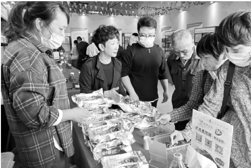
第四届(武夷)生态食品博览会举行 11月17日,观众在第四届(武夷)生态食品博览会上品尝武夷熏肥鹅。当日,第四届(武夷)生态食品博览会在福建光泽举行。此次博览会旨在做大做强绿色食品产业,加快把生态优势、资源优势转化为经济优势和产业优势。博览会期间还将举行中国生态食品产业发展之路研讨会等。

截至二季度末,纳入统计范围的保险公司平均综合偿付能力充足率为242.6%,平均核心偿付能力充足率为230.4%,保险业偿付能力充足稳定。