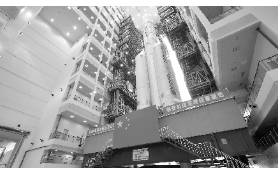
直测试厂房,平稳行驶约2小时后,将长征五号遥五运载火箭安全转运至发射场一号发射工位。后续,在完成火箭功能检查和联合测试等工作并确认最终状态后,火箭将加注推进剂,按程序实施发射。

长征五号遥五运载火箭于9月下旬由远望运输船队安全运抵海南文昌清澜港,并通过公路运输方式分段运送至中国文昌航天发射场。此后,火箭按照测试发射流程,陆续完成了总装、测试等各项准备工作。