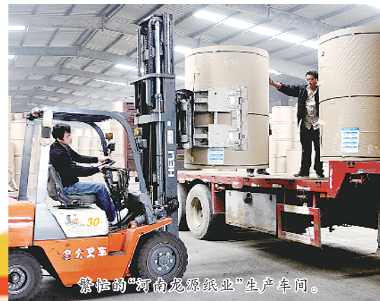
繁忙的“河南龙源纸业”生产车间。