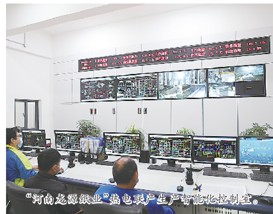
“河南龙源纸业”热电联产智能化控制室。