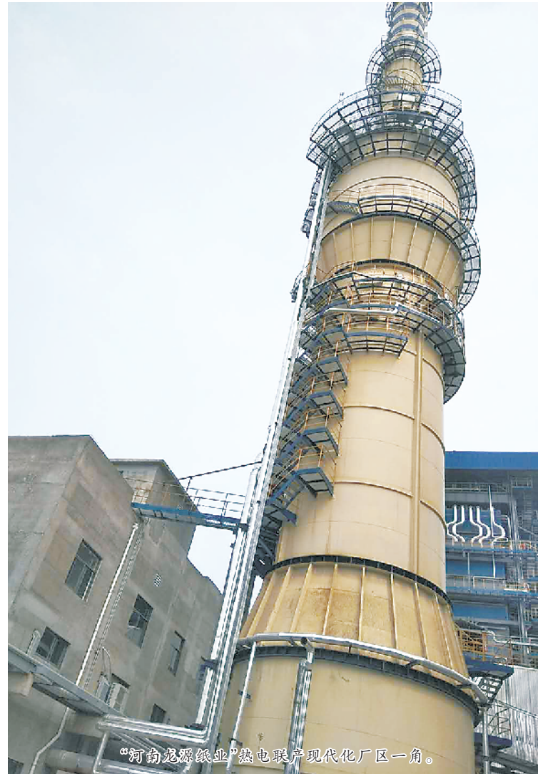
“河南龙源纸业”热电联产现代化厂区一角。