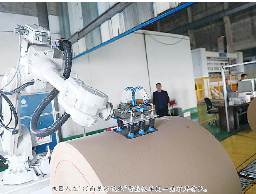
机器人在“河南龙源纸业”智能化车间一角有序作业。