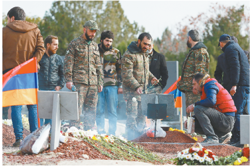
纳卡冲突停火 亚美尼亚安葬阵亡士兵 11 月 20 日，在亚美尼亚首都埃里温一处公墓，当地民众安葬在纳卡冲突中阵亡的士兵。 俄罗斯、阿塞拜疆和亚美尼亚三国领导人 11 月 9 日签署声明，宣布纳卡地区从莫斯科时间 10 日零时（北京时间 10 日 5 时）起完全停火。根据该声明，阿塞拜疆与亚美尼亚将交换战俘、其他关押人员和遇难者遗体，俄将在纳卡地区部署维和部队。

新华社利雅得 11 月 21 日电（记者 涂一帆）二十国集团领导人 21 日强调，国际社会必须继续加强协调与合作，应对新冠疫情。 二十国集团领导人第十五次峰会 21 日以视频方式拉开帷幕。此次峰会为期两天，由轮值主席国沙特阿拉伯主办。 峰会首日，沙特举办了一场“大流行病的防范与应对”边会。二十国集团领导人与国际组织代表在会上强调，必须继续加强协调应对新冠疫情大流行，特别是支持最脆弱群体，同时增加疫情防控相关支出，用于疫苗等的进一步研究和创新。 会后发表的声明说，世界正在经历一场规模空前和异常严重的卫生和经济危机。二十国集团领导人在今年 3 月沙特主持召开的应对新冠肺炎特别峰会上承诺，尽一切努力战胜疫情，与国际社会一道保护生命。今天二十国集团领导人再次聚首，目标是确保采取必要的后续行动，建设一个更安全的世界，塑造一个包容、可持续和有韧性的未来。 沙特国王萨勒曼在边会上表示，新冠疫情大流行表明，国际合作是克服危机的最佳途径。他呼吁关注世界最脆弱群体，为世界上所有国家提供支持。“只有当每个人都安全，我们才会安全。” 二十国集团于 1999 年成立，由中国、阿根廷、澳大利亚、巴西、加拿大、法国、德国、印度、印度尼西亚、意大利、日本、韩国、墨西哥、俄罗斯、沙特阿拉伯、南非、土耳其、英国、美国以及欧盟等 20 方组成。