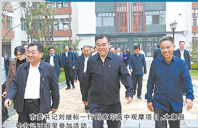
市委书记刘继标一行到康印高中观摩项目，太康县委书记王留国参加。