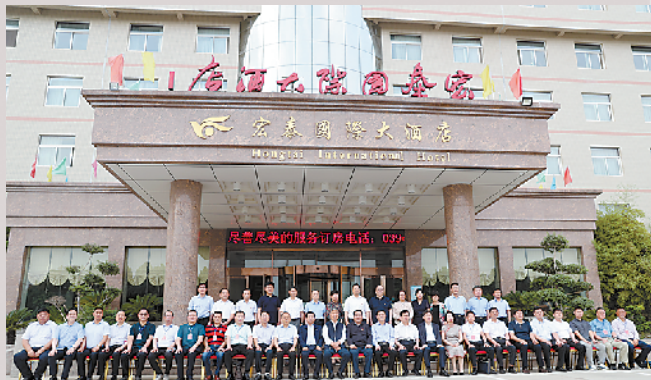
太康县四个班子领导与县招商大使、经济顾问等合影留念。