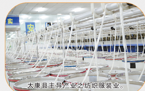
太康县主导产业之纺织服装业。