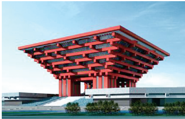
项城防水人参与施工上海世博园。