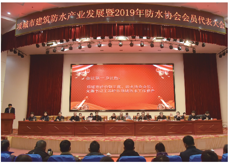
每年农历正月初六,项城市都会召开全市建筑防水产业发展大会,市四个班子领导及防水企业家代表400多人参加会议。这是2019年年会现场。