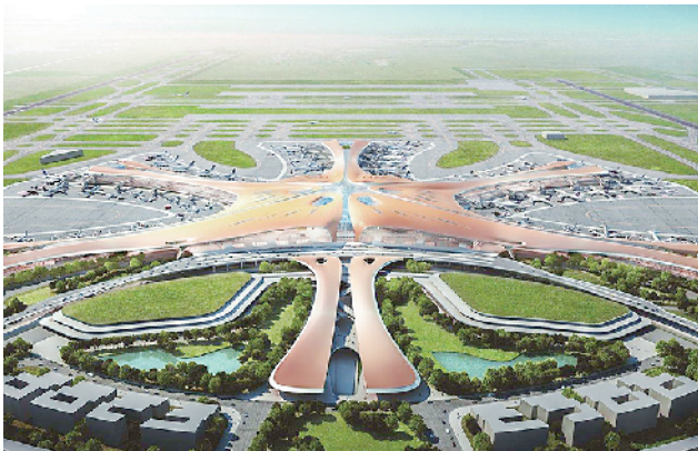
项城防水人参与施工的首都机场。