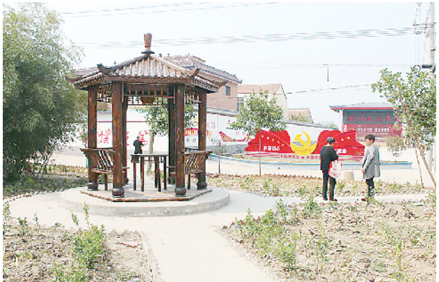
项城防水人积极参与家乡美丽乡村建设,这是企业家捐资兴建的农村文化广场。