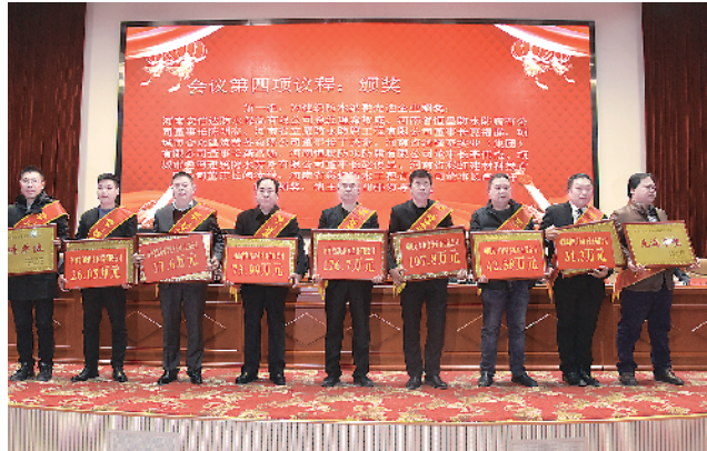
项城市委、市政府为建筑防水纳税先进企业颁奖。