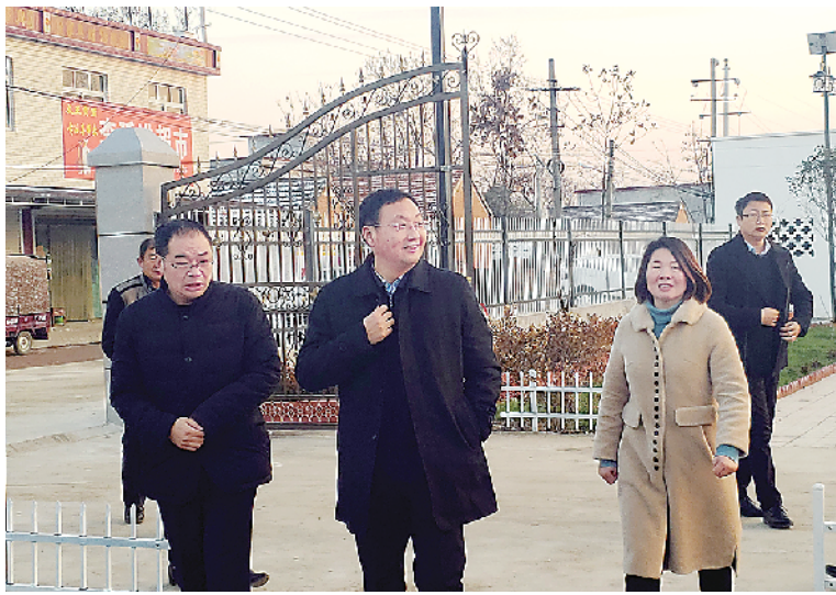
项城市市长王富生在中国建筑防水第一镇贾岭镇调研美丽乡村建设。