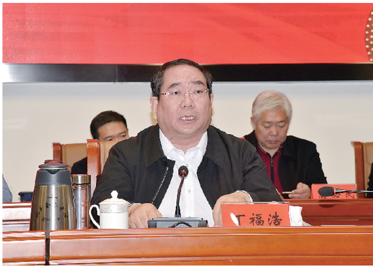
2019年2月10日,周口市市长丁福浩出席项城市建筑防水产业发展暨2019年防水协会会员代表大会,并作重要讲话。