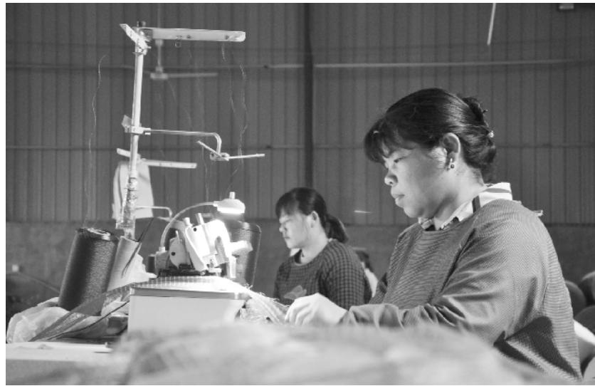
商水县练集镇按照一镇一主业要求，在中杨庄村设立镇工业园区，在各村设立村扶贫车间，大力发展渔网编织业，全力打造河南最大的渔网小镇，成为乡村振兴的有力抓手。图为村民在扶贫车间用电动机械加工渔网。

在“萌芽”、化解在基层。 聚焦换届“关键点”。严格按照先审计再换届的原则，镇纪委牵头镇财税所、农业农村服务中心、内审小组，全面启动对上届村干部离任审计和各村“三资”清理工作，并将结果及时进行公示“晾晒”，接受党员群众监督。针对审计出问题的村，严肃追究相关责任人的责任，以确保各村“三资”管理“家底清”、情况明。 目前，该镇累计走访干部开展谈心谈话30人(次)，收集意见建议5条，全镇村“两委”换届选举工作正按照时间节点顺利进行。