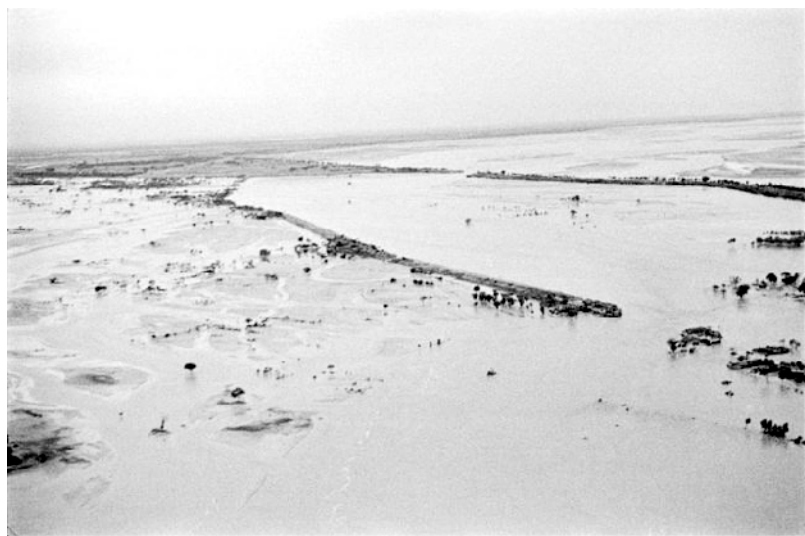
航拍1938年的黄泛区(资料图片)

“百里不见炊烟起，唯有黄沙扑空城。无径荒草狐兔跑，泽国芦苇蛤蟆鸣。”黄泛区人对这首无题诗可谓是耳熟能详。在需要描述黄泛区当年灾难情景的时候，无论是基层领导的讲话稿，还是中学生的演讲稿；无论是新闻媒体的记者，还是文学爱好者，都喜欢引用这几句诗。笔者作为黄泛区的一个文史工作者，也曾多次在公开发表的文章中引用此诗。但这首诗的原作者是谁，却一直不甚清楚。