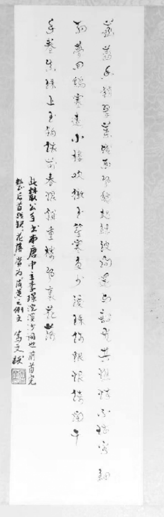
张伯驹书法真迹孤品