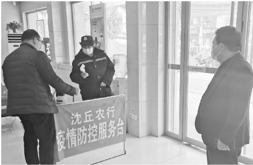
近日, 农行周口分行按时对自助机具和营业厅进行消毒, 在营业厅门口设立疫情防控服务台, 扎实做好疫情防控工作。图为农行沈丘支行网点保安为客户测量体温。