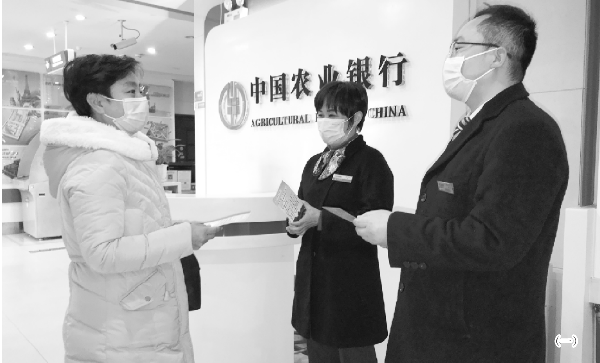
图一: 为让更多市民享受到金融服务带来的便利和实惠, 近日, 农行周口分行聚焦便民利民, 为群众带来服务优、效率高的优质服务体验, 打通便民服务“最后一公里”, 受到群众的广泛称赞。图为 1 月 22 日, 农行八一路支行大堂工作人员向客户介绍农行手机银行超值钜惠活动。

市场、进社区、进单位、进乡村外拓活动, 为城乡居民提供上门服务, 帮助特殊群体现场办理业务。1 月 1 日以来, 该行已累计组织开展外拓活动和上门服务 16 场次, 覆盖批零商户、企事业单位、城镇社区、偏远乡村和行动不便的客户群体, 为客户办理手机银行、收款码、信用卡、ETC 等业务, 有效扩大服务半径, 群众足不出户就能享受到快捷的金融服务。 确保机具正常运行, 提高自助设备服务效率。在客流旺季来临之前, 新年伊始, 该行未雨绸缪, 提前部署, 提高应对处置突发事件的能力, 专门对布放的所有自助机具进行一次全面体检和保养, 做到防患于未然; 指定专人对自助存取款机、转账查询机器等进行 24 小时监测, 遇到缺钞、故障等情况, 立即指派工作人员修理维护, 确保各种设备全天候正常运转, 满足客户的即时需求。