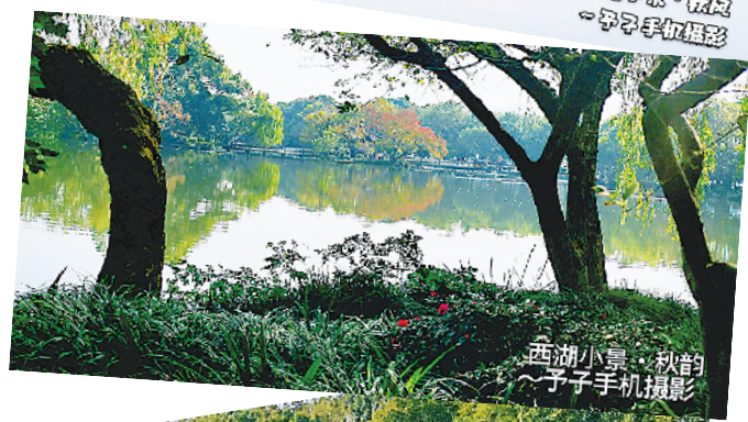
西湖小景·秋韵