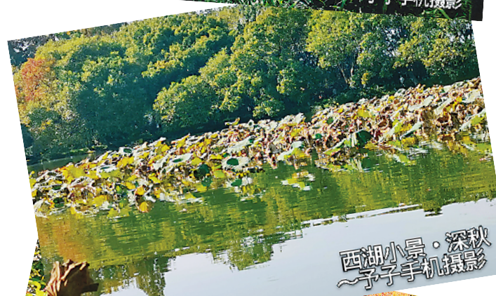
西湖小景·深秋