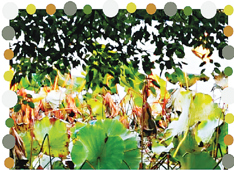
西湖深秋荷色 ~予子手机摄影