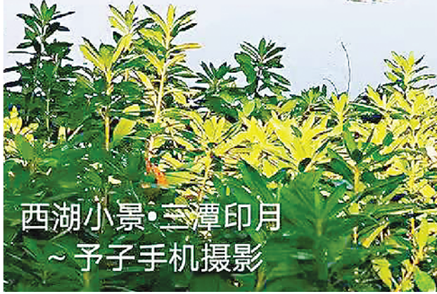
西湖小景·三潭印月