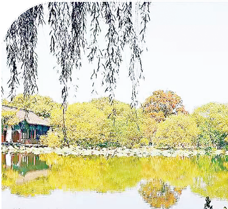
西湖小景·岸那边 ~予子手机摄影