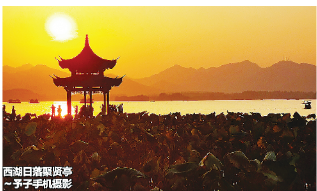
西湖日落霞晖亭 ~予子手机摄影