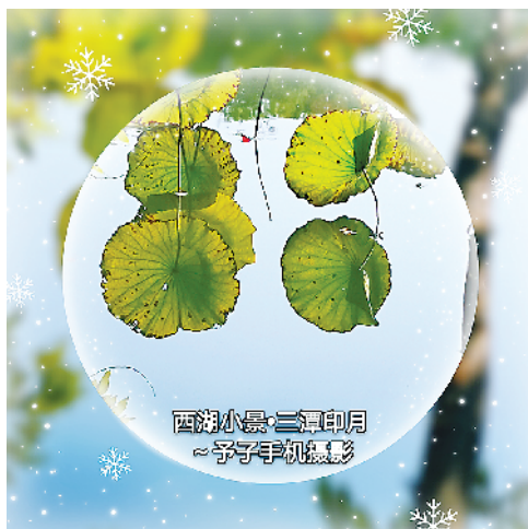
西湖小景·三潭印月