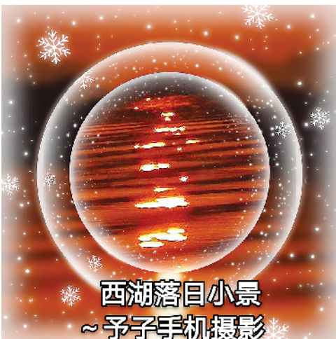
西湖落日小景 ~予子手机摄影