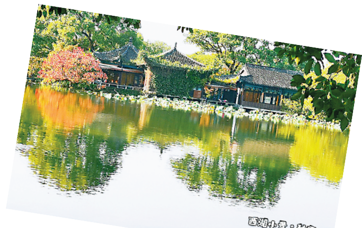
西湖小景·秋意

悠久的文化名城，水资源丰富，水文化深厚，在文化发展和城市建设上有很多相通之处。周口在城市建设和管理方面积极吸收杭州的经验和借鉴，增强水文化的挖掘和水系的治理开发，注重水文化的开发和研究，加大沙颍河建设和龙湖的开发和保护力度，逐步打造出周口独特的文化内涵。 原二炮副政委程宝山将军，利用去杭州之机，考察了解杭州西湖景区的特色和文化展示，探讨西湖文化的内涵，展示西湖的醉人风景。本报积极与程宝山联系，选取他西湖手机摄影部分作品，以饯家乡父老，也为周口的沙颍河、龙湖开发和保护提供借鉴。