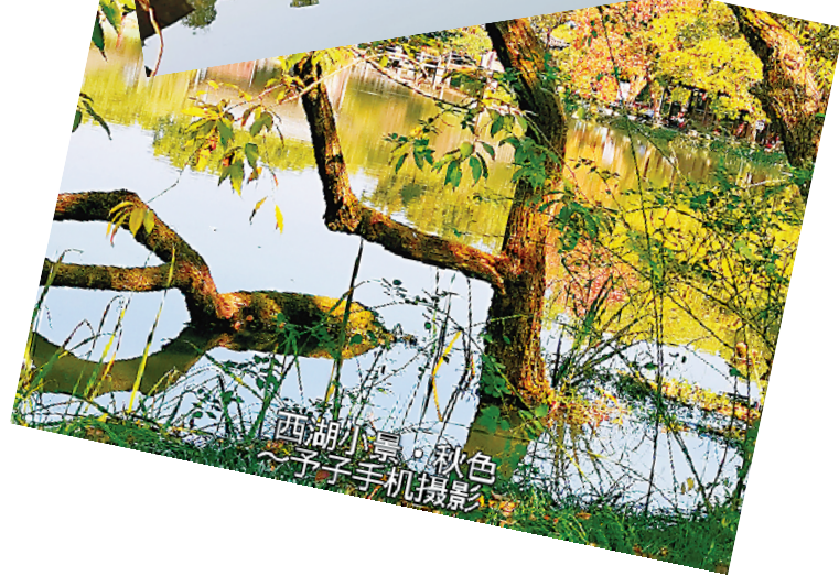
西湖小景·秋色 ~予子手机摄影