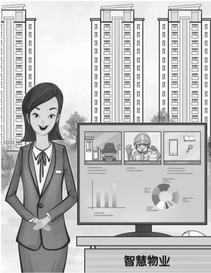
实思 文

随着我市城市化进程的不断加快,城内绿色空间相对稀缺,市民活动场所稀少,“休闲难”问题日益凸显。为满足人民日益增长的美好生活需要,近年来,我市充分挖掘资源,找出一些可供利用的闲置空地,拿出“绣花”的功夫,打造出一