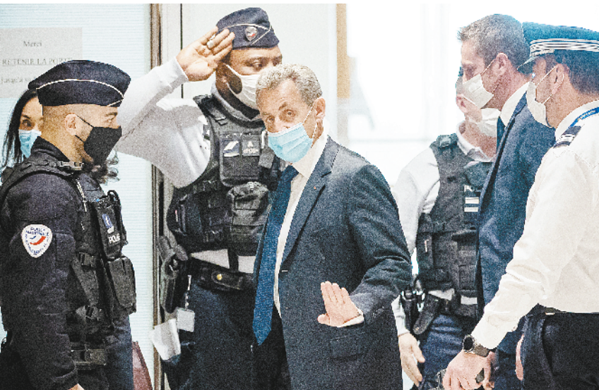
法国前总统萨科齐被判3年有期徒刑

亚美尼亚表示坚持一个中国原则,赞赏中国在消除贫困、创造就业、保障人民健康权和保护环境等方面的决心和努力。