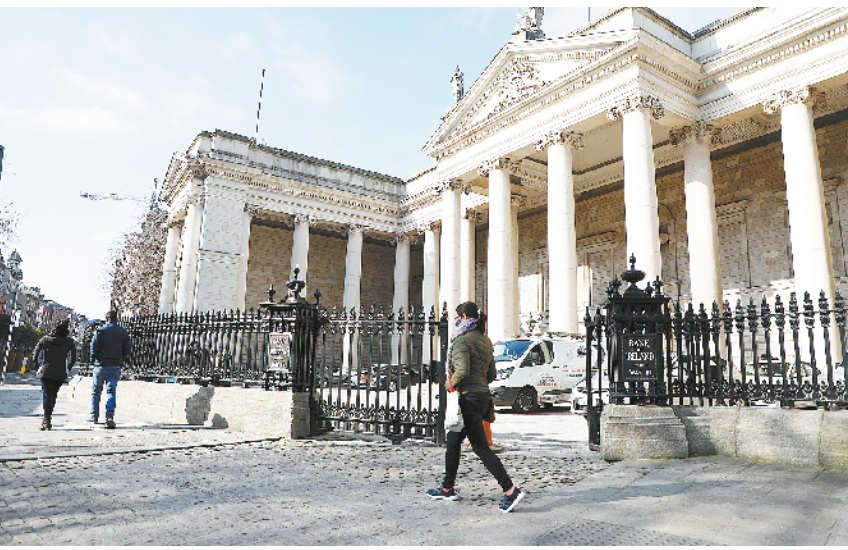
爱尔兰银行将关闭103家分行

卡舒吉遇害前为《华盛顿邮报》等多家媒体供稿,2018年10月2日进入沙特驻土耳其伊斯坦布尔领事馆后遇害。同年10月25日,沙特检察机关宣布卡舒吉死于谋杀,并于2020年9月公布了涉案人员的终审判决结果,包括5人被判处20年监禁,1人被判处10年监禁,2人被判处7年监禁。