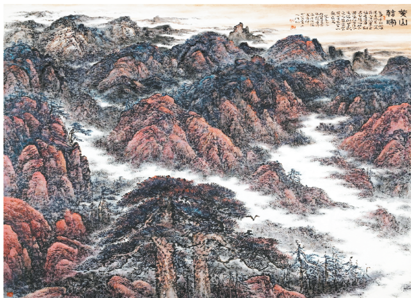
郭保同绘画作品《黄山朝晖》