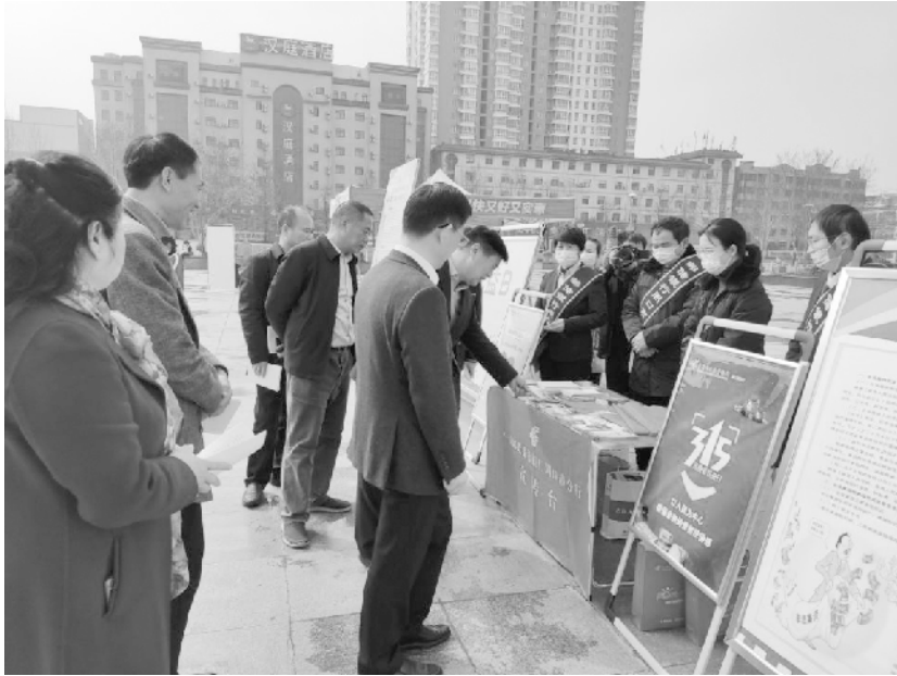
消费者权益保护和反洗钱知识活动现场

本报讯(记者 韩志刚 通讯员 郭哲一)为切实履行社会责任和义务,加强公众教育服务,切实维护消费者合法权益,2021年3月15日上午,邮储银行周口市分行按照周口市监管部门的统一部署,在市区五一广场开展了以“以人民为中心 增强金融消费者获得感”为口号的消费者权益保护和反洗钱知识宣传活动。通过悬挂宣传条幅、设置金融知识宣传台、摆放宣传海报、发放宣传折页、一对一讲解案例等多种方式,向广大群众普及个人账户信息安全、银行账户使用注意事项及非法集资和新型网络电信诈骗手段,引导消费者树立科学投资理财理念,增强消费者的安全防范意识和公众的防诈骗能力。