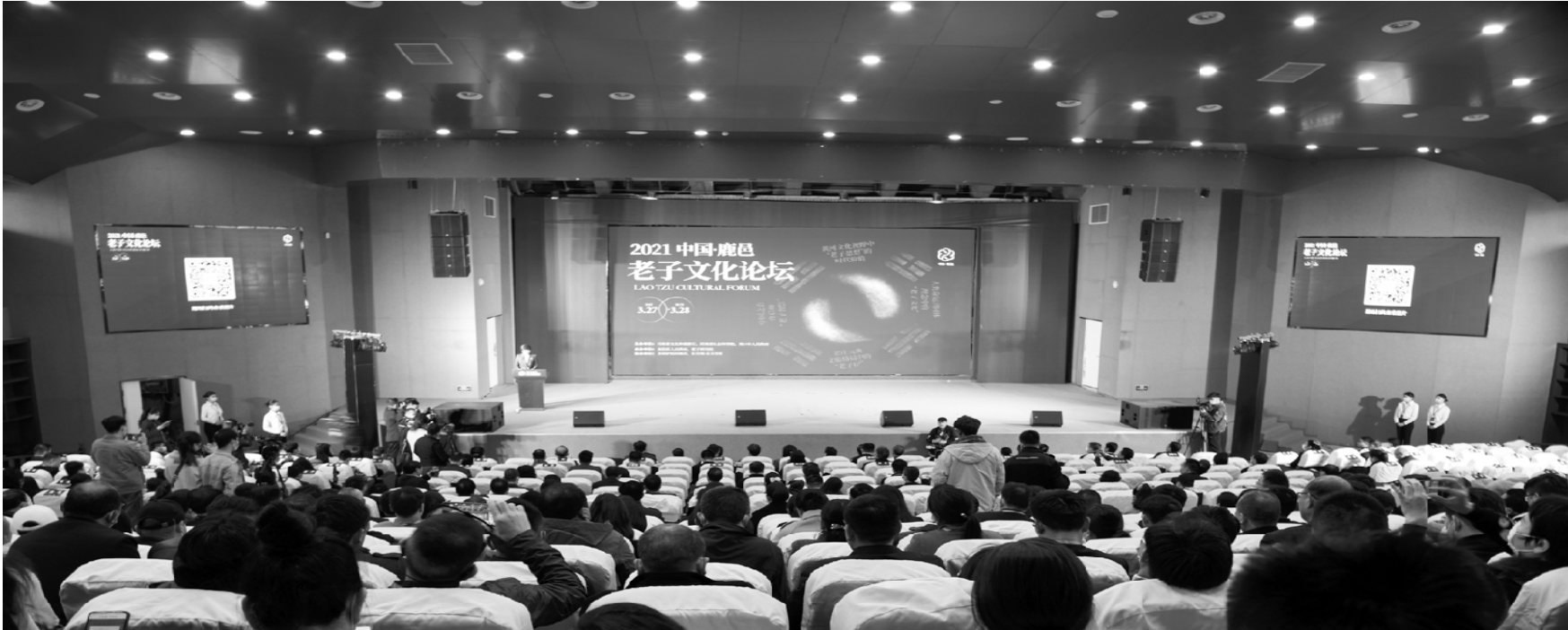
2021 中国·鹿邑老子文化论坛现场。

第三,加强区域合作,策划精品旅游线路,打造具有更大影响力的文化旅游目的地。在旅游开发中,必须树立大旅游观念,既要重视发挥自身的资源优势和特色,又要注重与周边地区的互补,加强与周边地区的通力协作,加大对区域内各种资源的整合力度,才能提升区域旅游形象,拓展区域旅游的发展空间,进而达到整个区域健康、快速发展的目的。