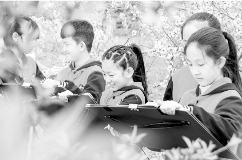
河北邯郸:“田间课堂”绘春光

数据显示,截至2021年2月末,全国地方政府债务余额260166亿元。其中,一般债务129499亿元,专项债务130667亿元;政府债券258415亿元,非政府债券形式存量政府债务1751亿元。同期,地方政府债券剩余平均年限为6.7年,其中,一般债券6.1年,专项债券7.3年;平均利率为3.51%,其中,一般债券3.51%,专项债券3.50%。