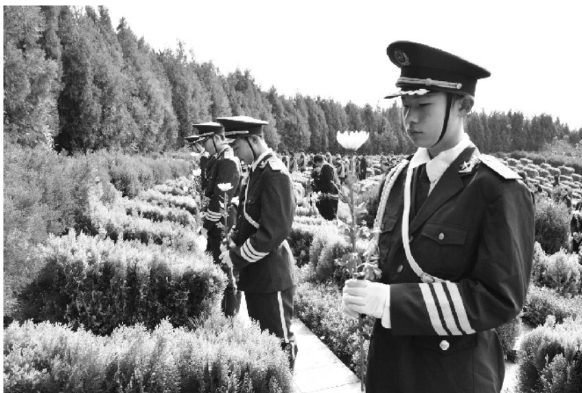
近日,项城市第二初级中学开展“清明祭英烈”活动,旨在弘扬以爱国主义为核心的民族精神和中华民族优秀传统文化,引导青少年不断增进爱党、爱国、爱人民、爱中华民族的情感。

通过此次演练,该校师生进一步树立了“安全第一”的思想,强化了师生安全教育,提高了师生的防范自救能力和学校应对突发事件的能力。