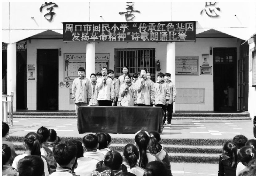
4月6日,周口市回民小学举行“传承红色基因,发扬革命精神”诗歌朗诵比赛。此次诗歌朗诵比赛让该校师生接受了一次爱党、爱国、爱校、爱家的洗礼,增进了爱党、爱国的情怀。