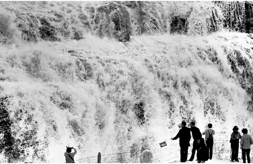
壶口瀑布：春水腾雾浪滔天

为，一律依法从重从严处罚。 会议指出，我国平台经济总体态势向好，但在快速发展中风险与隐患也逐渐累积，危害不容忽视，依法依规刻不容缓。强迫实施“二选一”、滥用市场支配地位、实施“掐尖并购”、烧钱抢占“社区团购”市场、实施“大数据杀熟”、漠视假冒伪劣、信息泄露以及实施涉税违法行为等问题必须严肃整治。其中，强迫实施“二选一”问题尤为突出，是平台经济领域资本任性、无序扩张的突出反映，是对市场竞争秩序的公然践踏和破坏。强迫实施“二选一”行为限制市场竞争，遏制创新发展，损害平台内经营者和消费者利益，危害极大，必须坚决根治。 会议强调，政策底线不可逾越，法律红线不可触碰。加强对平台企业违法违规行为的规范治理，并不意味着国家支持和鼓励平台经济的态度有所改变，而是要坚持“两个毫不动摇”，尊重平台经济发展规律，进一步发挥平台经济的重要作用，建立公平竞争、创新发展、开放共享、安全和谐的平台经济新秩序，推动实现平台企业更加充满活力、线上消费更加便捷优质，平台经济更加繁荣有序。