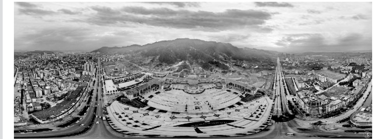
图①为 20 世纪 70 年代的黎平县东门翘街旧景 图②为黎平古城翘街上的黎平会议会址 图③为黎平全景