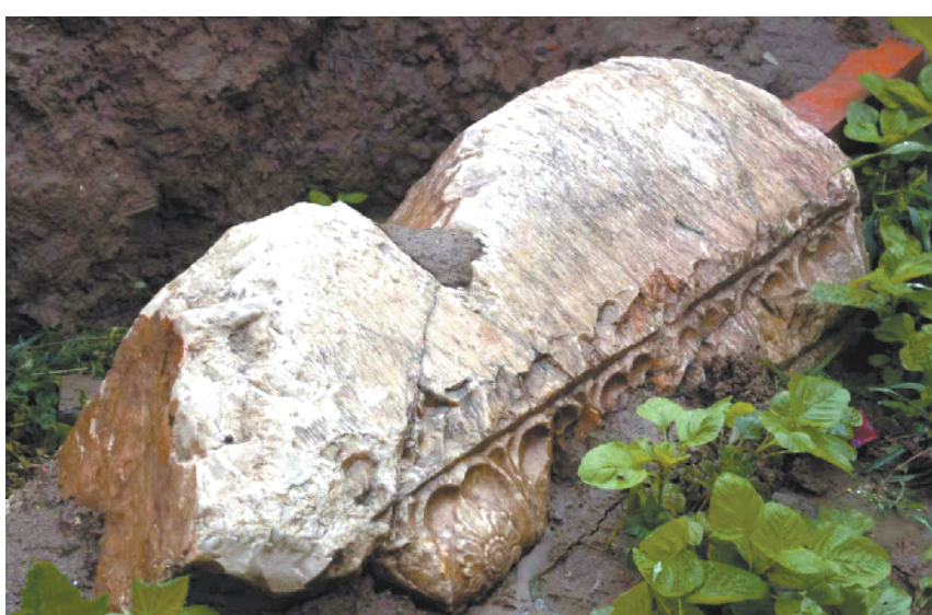
太清宫遗址出土的唐代汉白玉阙顶

在太清宫发现的碑刻墓志上至汉魏,中承唐宋,下迄当代,皆有精品。太清宫作为曾经的皇家家庙和世人祭拜老子的场所,碑刻是重要体现。历史记载的太清宫碑刻有很多,但随着时间的变迁,留