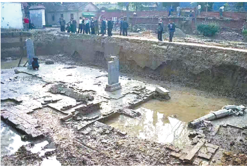
太清宫遗址发掘现场