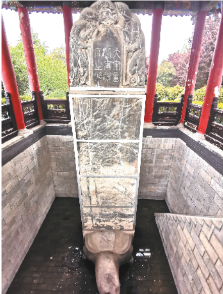
北宋重修太清宫之碑