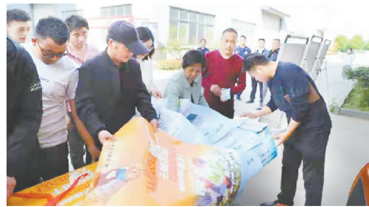
4月27日,港区工信办联合安全办、消防工作室开展“4·29”国际禁止化学武器组织日宣传暨安全生产部署活动,港区30多家企业负责人参加活动。活动现场,工作人员共设置宣传展板6块,悬挂条幅50多条,发放宣传海报200多张。

最后,孙鹏指出,青年事业是党的事业的重要组成部分,港区各相关部门要站在党和国家事业后继有人的战略高度,重视关心青少年工作,关爱呵护青少年成长,为青少年健康成长和事业发展创造条件。