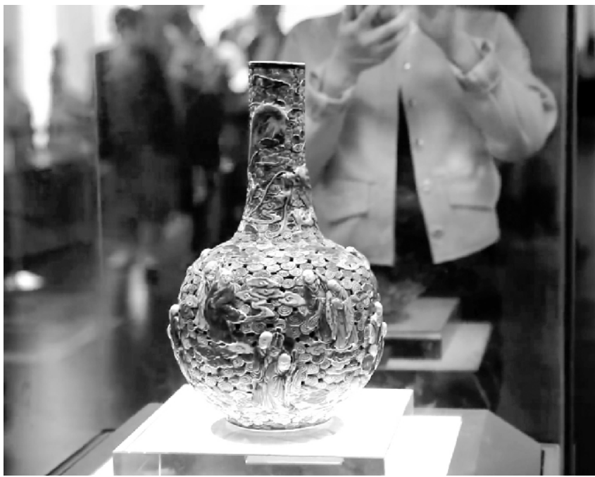
五彩透雕十八罗汉云龙瓶。