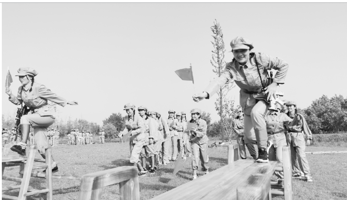
近日,周口市实验幼儿园组织教职工开展了一场主题为“礼赞建党百年”的红色运动会。该园负责人表示,开展红色运动会目的就是让教师传承革命前辈不怕苦、不怕累、不怕牺牲的红色精神,凝聚红色力量、永续红色基因,把党建文化与体育活动相结合,把党建引领和幼儿园发展相结合,为建党100周年献礼。

这次活动让同学们进一步认识到防溺水安全的重要性,提高了自救、自护能力,构筑了一道防溺水安全教育的防护网。