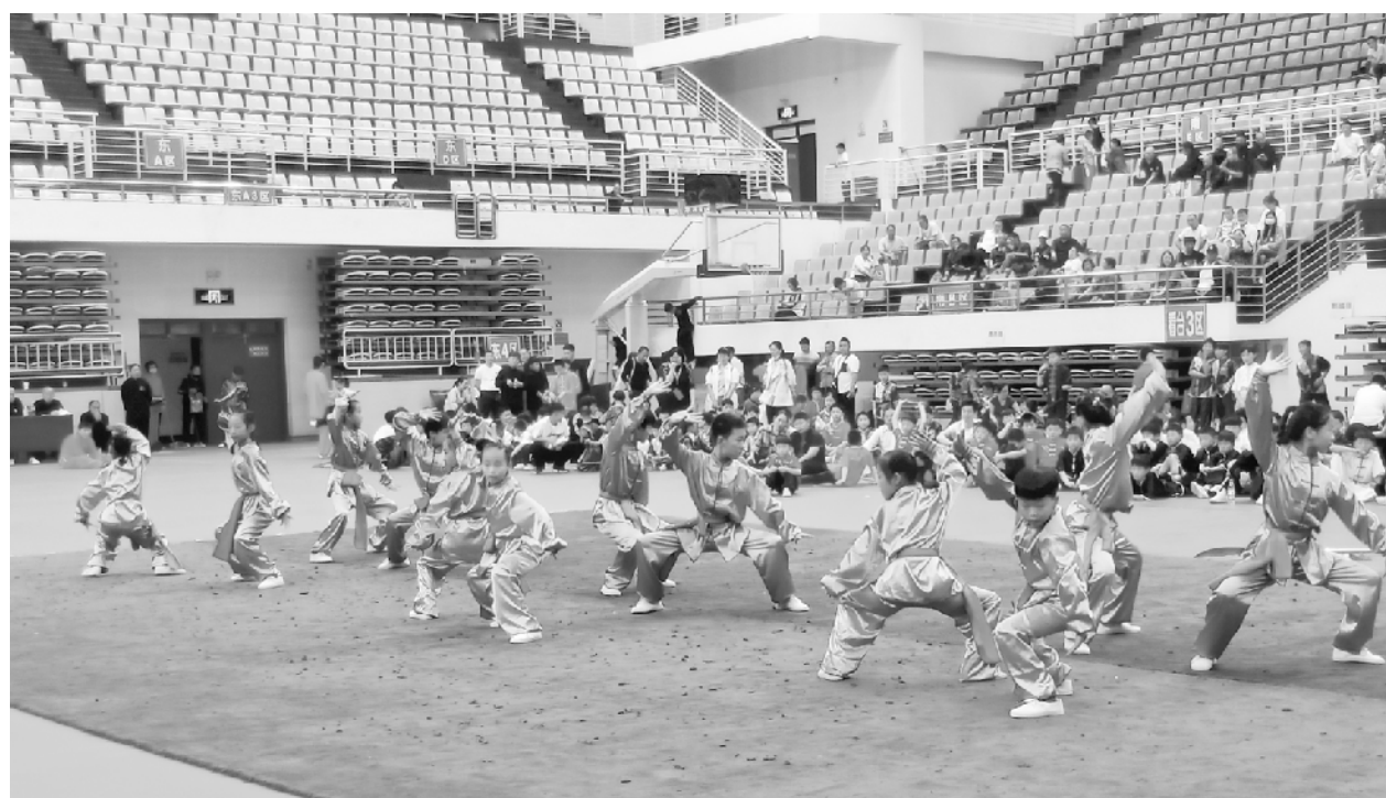
为传承中华武术文化,振奋民族精神,5月9日上午,周口市回民小学参加周口市“全民健身月”武术展演。图为该校学生正在展示国家级非物质文化遗产代表项目心意六合拳段位套路。

经过两天的激烈角逐,该市光武中心校、林陵中心校获得镇办组特等奖,新华学校、莲溪中学、第二初级中学、第九初级中学获得城区组特等奖。同时,比赛还评出了一二三等。观看比赛的领导为获奖代表队颁发了奖牌。