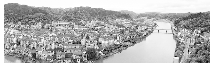
今日县溪镇。