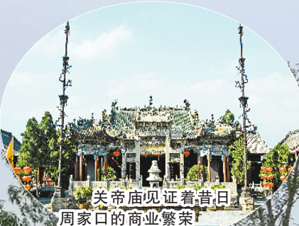
关帝庙见证着昔日周家口的商业繁荣

随之出现的一个又一个新地标，所反映的周口文化也从单一的商业文化，向商业、旅游、健身等多元文化发展。③5