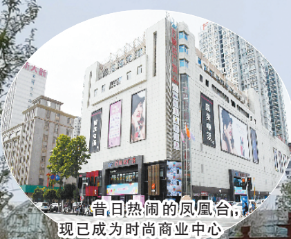
昔日热闹的凤凰台，现已成为时尚商业中心