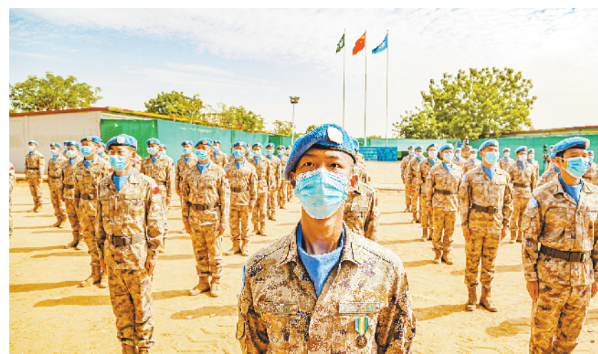
中国第16批赴苏丹达尔富尔维和工兵分队官兵荣获联合国“和平荣誉勋章” 5月20日,官兵在苏丹达尔富尔法希尔超级营地中国营区参加授勋仪式。中国第16批赴苏丹达尔富尔维和工兵分队225名官兵20日被授予联合国“和平荣誉勋章”,并荣获联合国和非洲联盟驻苏丹达尔富尔联合特派团(联非达团)嘉奖。

新冠疫情在美暴发以来,美国针对亚裔的歧视、骚扰和暴力事件不断增加,迄今未见消减迹象。美国反歧视组织“制止仇恨亚裔美国人组织”发布的数据显示,去年3月中旬至今年3月底,该组织收到逾6600起针对亚裔美国人仇恨事件的报告。加利福尼亚州立大学圣贝纳迪诺分校仇恨和极端主义研究中心近日发表的报告显示,今年第一季度,美国主要城市的反亚裔仇恨犯罪事件比去年同期增加了169%。