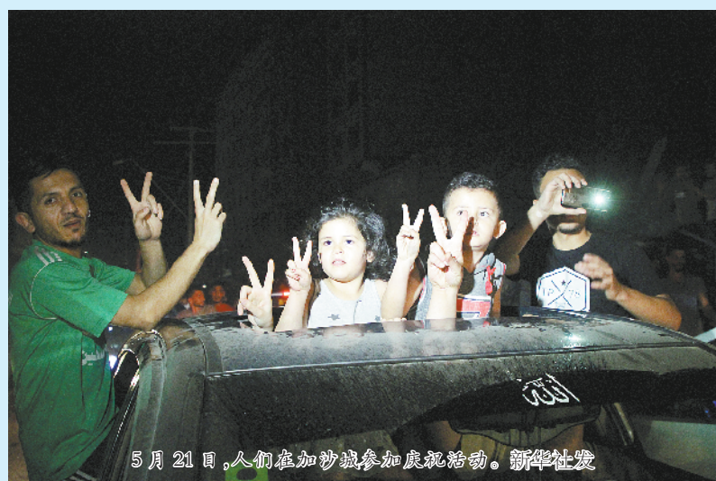
5月21日,人们在加沙地带参加庆祝活动。

以色列总理办公室20日晚发表声明说,以色列在近期对加沙地带的军事行动中取得了“巨大成就”。以安全内阁当晚一致同意接受埃及斡旋的停火协议。但声明未提及停火协议生效时间。