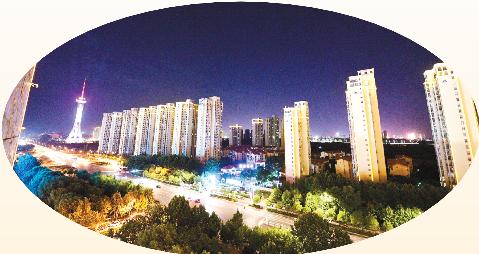
一窗一灯小世界，繁星万点一座城

位于沙颍河北岸的文昌大道同样是我市的一条主干道，连接着老城区与新城区。夜幕下，这里灯光璀璨、色