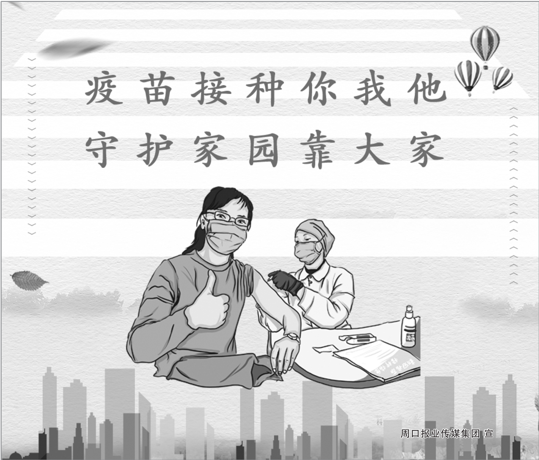
周口报业传媒集团 宣