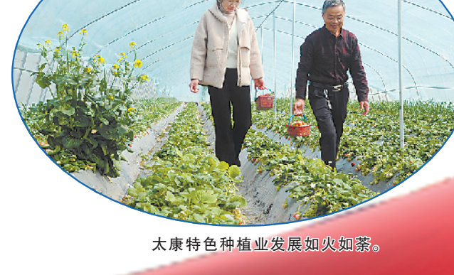
太康特色种植业发展如火如荼。