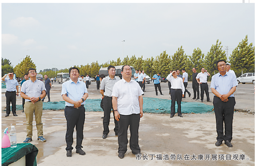
市长尹福浩带队在太康开展项目观摩。

策部署,以脱贫攻坚为统领,统筹推进疫情防控和经济社会发展,扎实做好“六稳”工作,全面落实“六保”任务,在“三个走在省市前列”基础上,奋力打造全面小康样板、奋力打造县域经济高质量发展样板、奋力打造乡村振兴样板“全市三个样板”,疫情防控形势稳定,经济回稳态势向好,全县高质量发展迈出新步伐,“十三五”规划确定的目标任务总体完成,决胜全面建成小康社会取得决定性成就,为开启全面建设社会主义现代化新征程奠定了坚实基础。