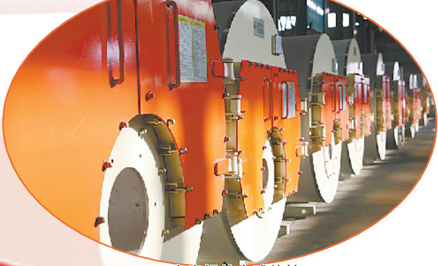
太康锅炉全球热销。