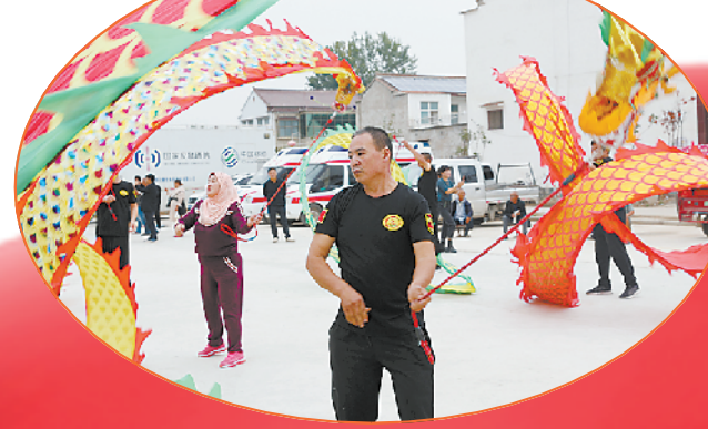
奔走在小康路上,幸福的笑容。