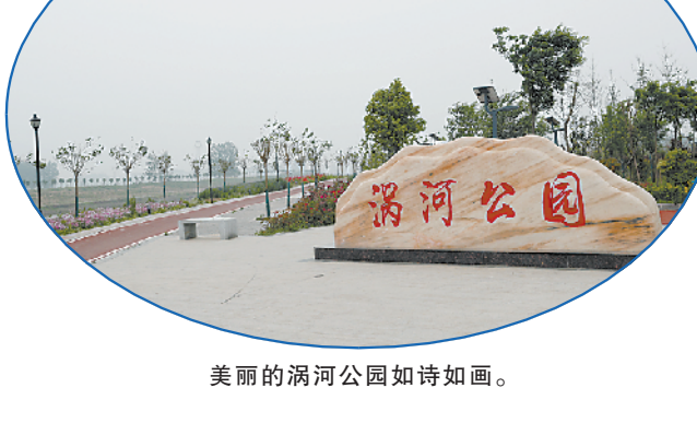
美丽的浉河公园如诗如画。