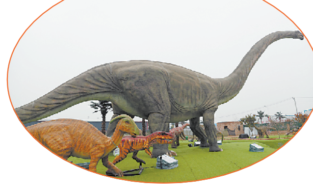
太康县刘寨镇刘寨村一角。