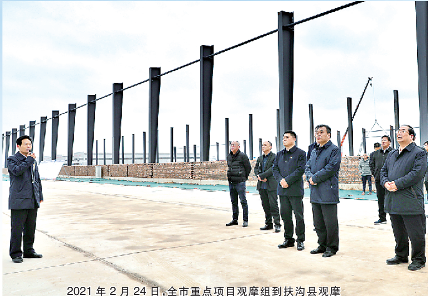
2021年2月24日,全市重点项目观摩组到扶沟县观摩