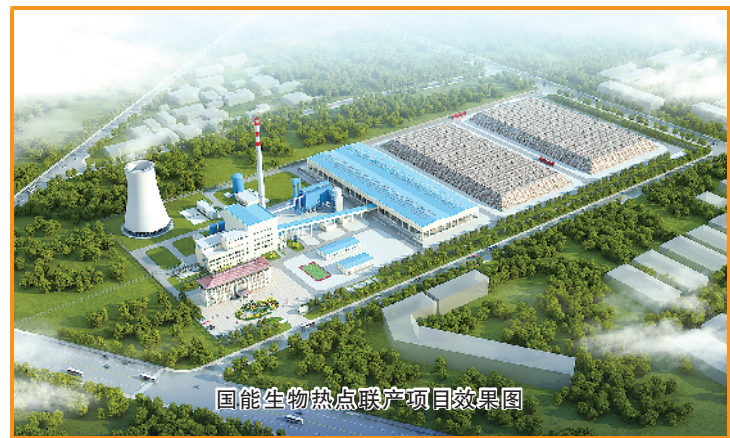
国能生物热电联产项目效果图