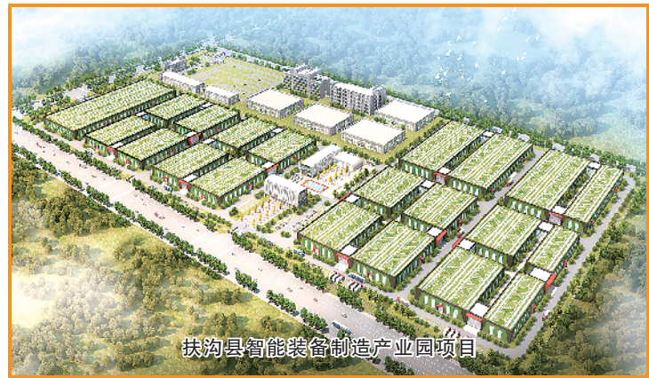
扶沟县智能装备制造产业园项目