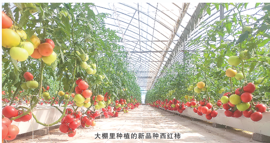
大棚里种植的新品种西红柿