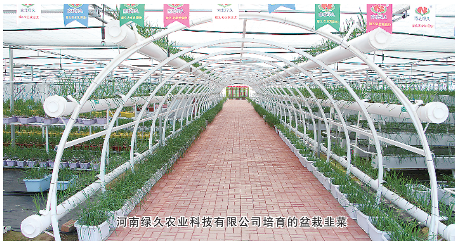
河南绿久农业科技有限公司培育的盆栽韭菜

一望田园千里秀,无边果蔬四时新。以蔬菜产业闻名的“全国果菜十强县”——扶沟县,地处豫东平原,是我国“南菜北运”“北菜南下”的最佳过渡带,享有“中国蔬菜之乡”“中原菜篮子”的美誉。 近年来,扶沟县通过实施规模化、标准化、品牌化融合发展,持续推进蔬菜产业转型升级,全力打造“中原菜都”,走出了一条扶沟特色的蔬菜产业化道路。 扶沟县先后与中国农业大学、中国蔬菜花卉研究所、河南农业大学、河南省农科院建立院院合作,并建成河南农业大学扶沟蔬菜研究院,120多名国家大宗蔬菜体系专家和教授为扶沟县蔬菜产业发展出谋划策、提供技术服务,每年选育瓜果新品种组合12000多种,展示推广新优瓜果品种2000多种。 “扶沟西瓜”和“扶沟辣椒”先后通过农业部地理标志认证,“扶沟辣椒”入选全国名特优新农产品名录,“南北绿韭”和“天御红”被评为“全国蔬菜十佳畅销品牌”,扶沟韭菜种子在全国市场占有率高达70%。全县拥有有机、绿色和无公害蔬菜品牌48个,“三品一标”产品76个。扶沟蔬菜可免检进入北京、上海、郑州等各大蔬菜市场,扶沟已成为有定价话语权的全国蔬菜主要集散中心之一。 围绕国家级现代农业产业园建设,扶沟县重点突出区域特色,优化顶层设计,实现了“一园三区十小镇”(中原菜博园、绿色蔬菜生产区、加工物流配送区、三产融合示范区和十个特色果蔬小镇)的蔬菜产业布局。截至目前,全县蔬菜专业合作社332家,其中,国家、省、市级示范合作社15家,市级以上蔬菜类农业产业化龙头企业16个;年育苗量300万株以上