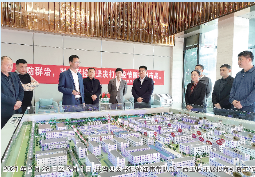
2021年2月28日至3月1日,扶沟县委书记孙红伟带队赴广西玉林开展招商引资工作