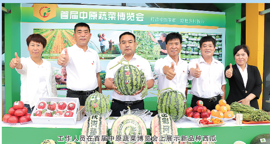
工作人员在首届中原蔬菜博览会上展示新品种西瓜