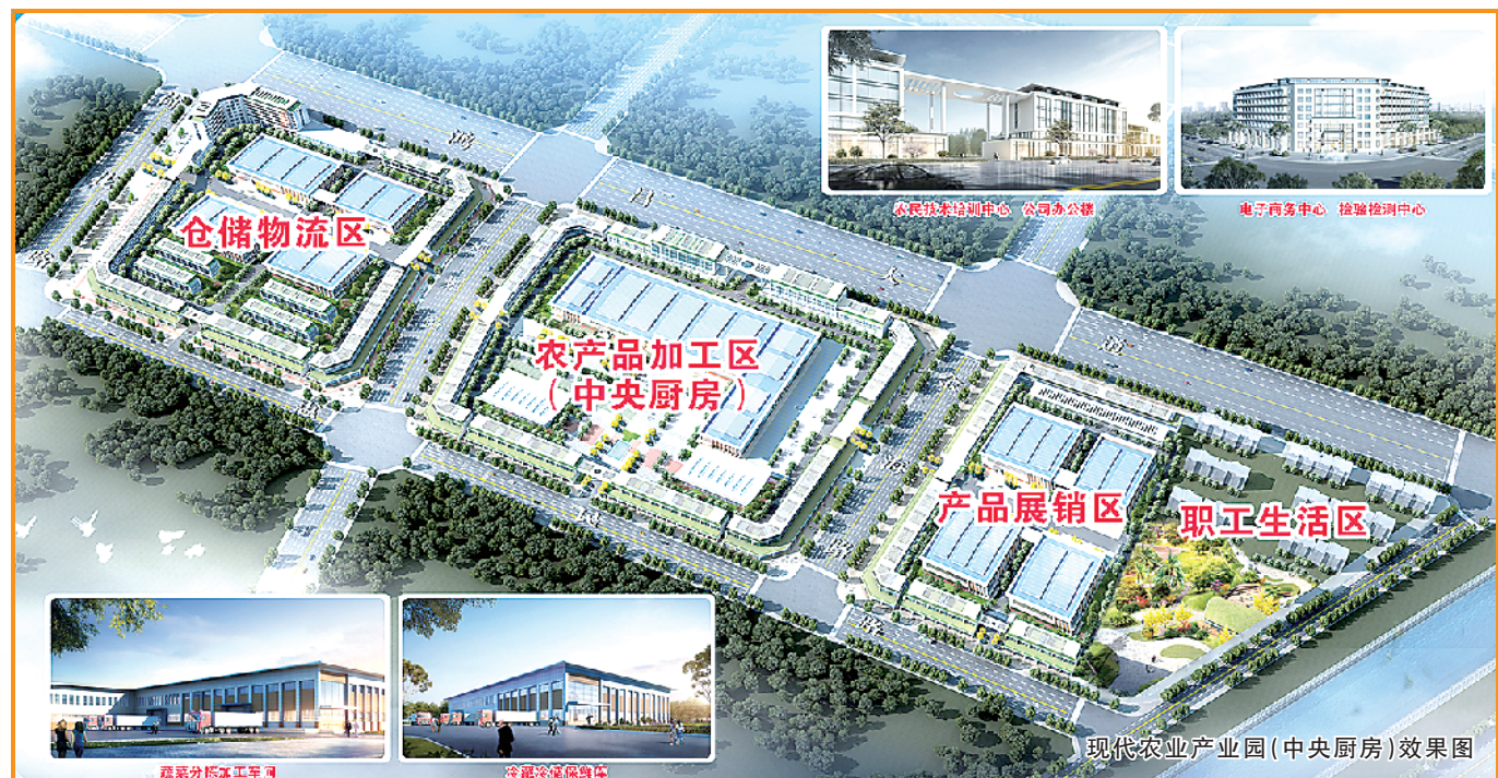
扶沟县智能装备制造产业园项目效果图