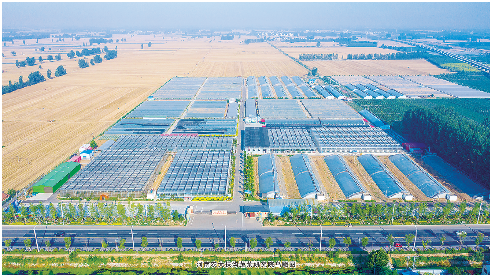
河南农大扶沟蔬菜研究院鸟瞰图

一望田园千里秀,无边果蔬四时新。以蔬菜产业闻名的“全国果菜十强县”——扶沟县,地处豫东平原,是我国“南菜北运”“北菜南下”的最佳过渡带,享有“中国蔬菜之乡”“中原菜篮子”的美誉。 近年来,扶沟县通过实施规模化、标准化、品牌化融合发展,持续推进蔬菜产业转型升级,全力打造“中原菜都”,走出了一条扶沟特色的蔬菜产业化道路。 扶沟县先后与中国农业大学、中国蔬菜花卉研究所、河南农业大学、河南省农科院建立院院合作,并建成河南农业大学扶沟蔬菜研究院,120多名国家大宗蔬菜体系专家和教授为扶沟县蔬菜产业发展出谋划策、提供技术服务,每年选育瓜果新品种组合12000多种,展示推广新优瓜果品种2000多种。 “扶沟西瓜”和“扶沟辣椒”先后通过农业部地理标志认证,“扶沟辣椒”入选全国名特优新农产品名录,“南北绿韭”和“天御红”被评为“全国蔬菜十佳畅销品牌”,扶沟韭菜种子在全国市场占有率高达70%。全县拥有有机、绿色和无公害蔬菜品牌48个,“三品一标”产品76个。扶沟蔬菜可免检进入北京、上海、郑州等各大蔬菜市场,扶沟已成为有定价话语权的全国蔬菜主要集散中心之一。 围绕国家级现代农业产业园建设,扶沟县重点突出区域特色,优化顶层设计,实现了“一园三区十小镇”(中原菜博园、绿色蔬菜生产区、加工物流配送区、三产融合示范区和十个特色果蔬小镇)的蔬菜产业布局。截至目前,全县蔬菜专业合作社332家,其中,国家、省、市级示范合作社15家,市级以上蔬菜类农业产业化龙头企业16个;年育苗量300万株以上