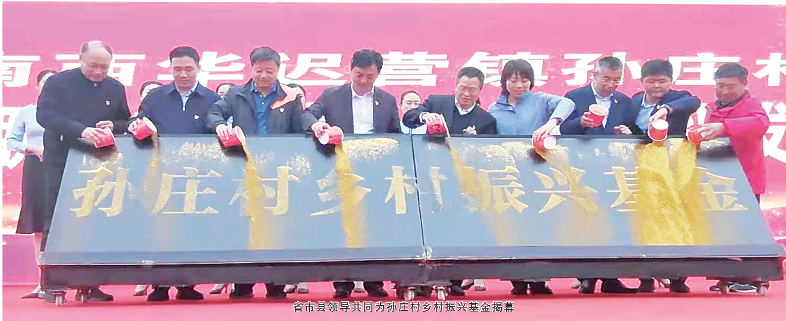
省市县领导共同为孙庄村乡村振兴基金揭幕

6月23日,暑气蒸腾。走进西华县迟营镇孙庄村新时代党群服务中心大厅,这里宽敞明亮,清凉舒爽,设有综合业务办理等专门窗口,为群众提供7类29项“一站式”全程代办服务,打通服务群众“最后一公里”,真正让群众“只进一扇门、只找一个人、办成一件事、叫上一声好”。