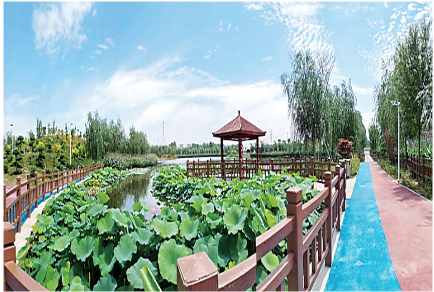
迟营镇中水利用公园景色宜人