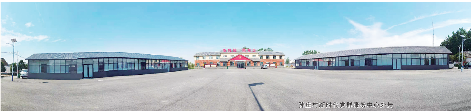
孙庄村新时代党群服务中心外景

郑昊充满信心地说,今年是“十四五”开局之年,迟营镇将进一步发挥党建工作的示范、引领和带动作用,真正做到敢于担当、勇于负责、善于作为,努力补齐迟营农业农村短板,在乡村发展中展现新作为,在干事创业中展现新担当,在作风建设中展现新气象,切实为迟营镇在乡村振兴中提供强大动力。