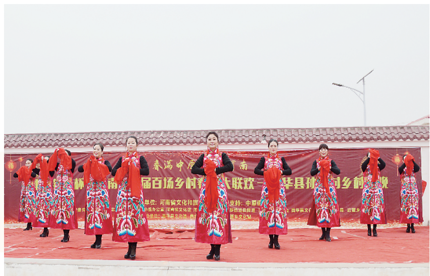
群众文化活动蓬勃发展