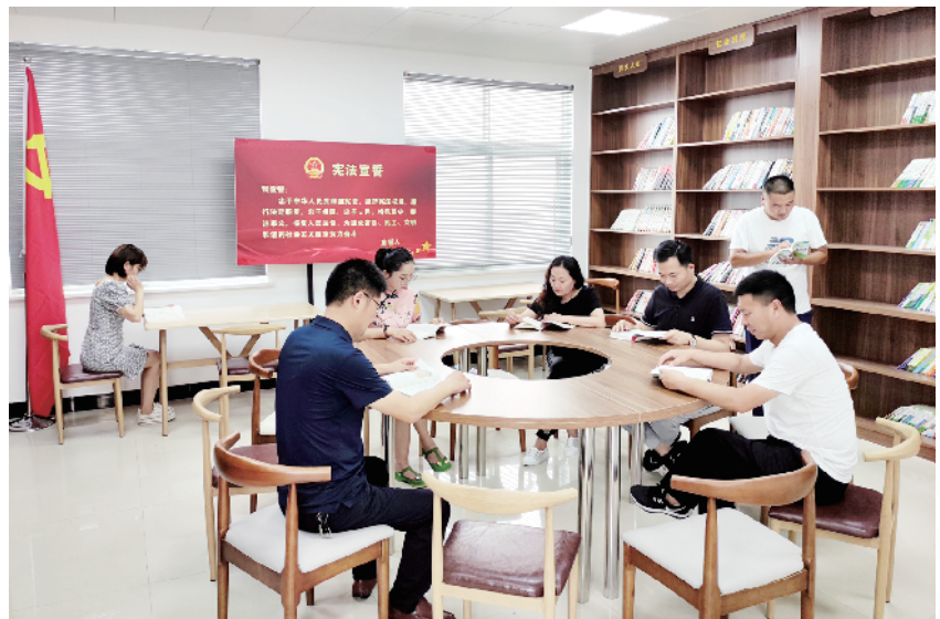
迟营镇党校“党建书吧”