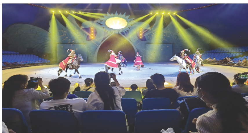
周口杂技文化产业园马戏表演