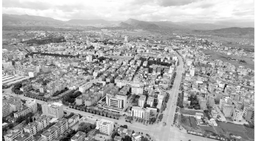
空中俯瞰现在的宾川县城。