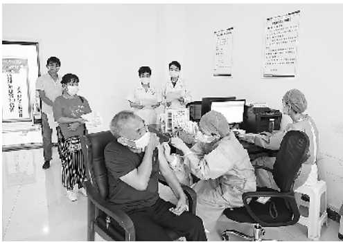
第四医健集团疫苗接种有条不紊推进。