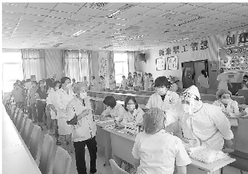
第四医健集团全员核酸检测防疫。