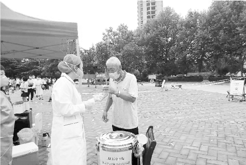
8月10日，川汇区中医院医务人员熬制防疫中药汤剂，在联盟新城核酸检测现场设立预防新冠肺炎中药饮用点，为群众免费提供中药汤剂，受到群众好评。

面对成箱的核酸标本，该院检测室人员加班加点，24小时不停工作，加快出具核酸检测报告单。截至目前，该院检测标本22092份，全部为阴性。