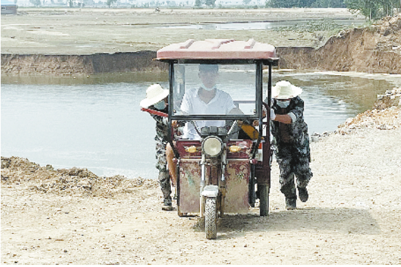
一位浚县小伙子和救援队员一起转移排涝设备。