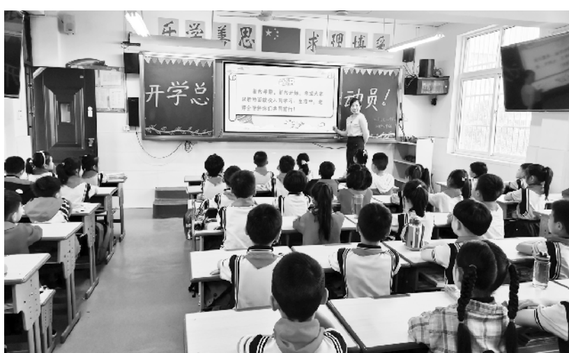
周口市莲花路小学积极开展“把灾难当教材、与祖国共成长”主题教育,帮助青少年扣好“人生第一粒扣子”。图为9月6日,该校师生同上“开学第一课”。