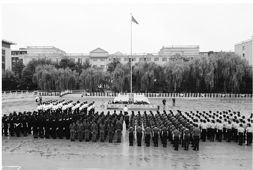
“立正、稍息、跨立、齐步走……”9月5日,周口新星学校举行教师军训汇演。会演中,教师们步伐有力、队列整齐、斗志昂扬,展现了良好的精神风貌。

化管理,严控人员聚集,错时、错峰上下学、家长接送、就餐等。三是办事处卫生服务中心工作人员分别进驻各校积极应对突发状况。四是川汇区教体局班子成员及疫情防控专班工作人员分别进驻各校,对开学情况进行督导,解决突发问题。五是各校上好“开学第一课”,进行安全教育,把疫情当教材,开展社会主义制度优越性教育。