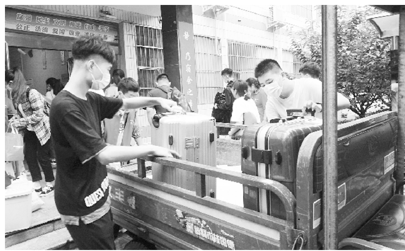
9月6日,周口一高严格按照疫情防控要求,按照错峰、错峰的原则,合理安排老师、志愿者迎接学生入校。图为志愿者为学生搬运行李。