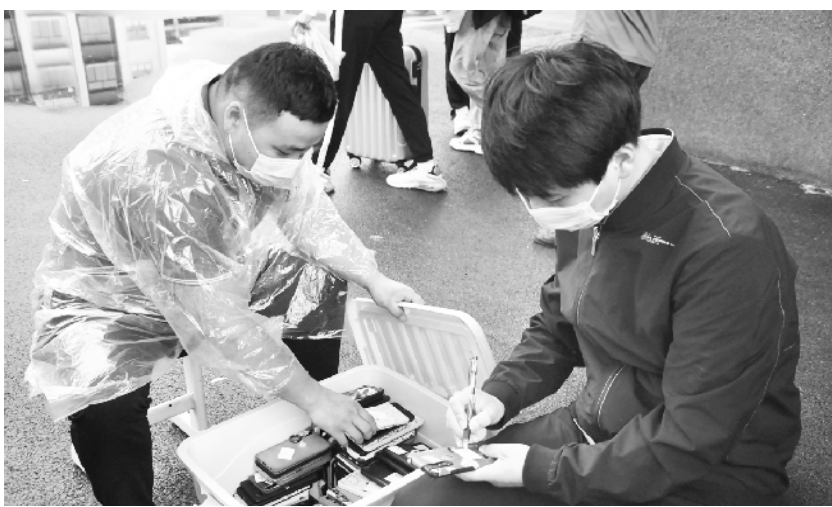
测体温、提交疫苗接种证明及14天健康报告……9月6日,周口市颍河高中分批、错峰、错峰开学。图为学生进入学校主动上交手机。