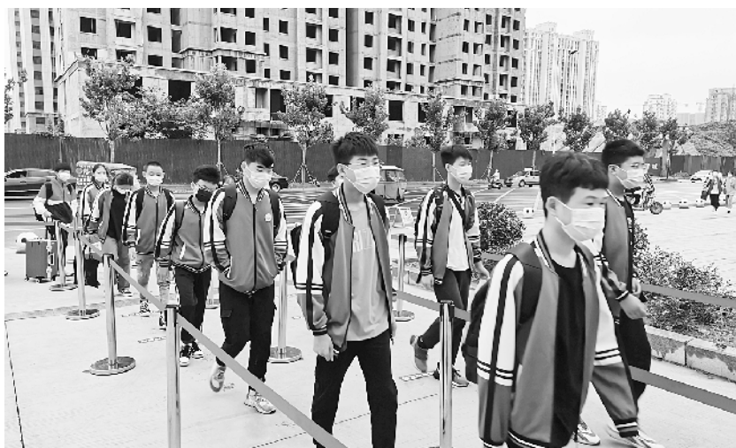
近期,全市各学校做好常态化疫情防控,倡导戴口罩、勤洗手、少聚集,并为师生制定“一人一档”信息台账。图为9月6日,周口经济开发区实验学校学生排队入校。