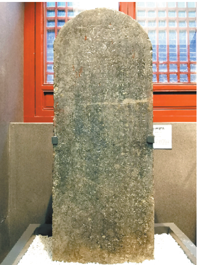
清代“学田膏火记”碑

二程去后，不复二程。他们身上传递出的那种不断探索、求实、创新的求知精神和学者的家国社稷意识，还有那充盈于荒寒长空之中的立雪情怀，至今还常常给我们以启迪，历久弥新。而大程书院，则寄托了历代文人对于文化思想的追求，永远驻留在这方土地上。当教育回归教育，文化回归文化，书院就呈现了它最原本的样子。大程书院这样一处清雅肃穆之地，一定会根植于莘莘学子心中，默默无声地发挥着它独特的精神文化作用。②6