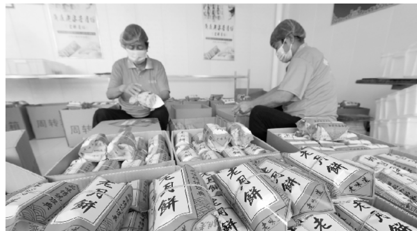
中秋将至月饼生产忙 9月12日,在河北省石家庄市藁城区九门回族乡黄庄村一家月饼生产手工坊,工人在包装手工月饼。中秋节临近,月饼迎来消费旺季,各地月饼生产企业抓紧加工、制作月饼,供应市场。

肖亚庆说,2012年到2020年,我国工业增加值由20.9万亿元增长到31.3万亿元,其中制造业增加值由16.98万亿元增长到26.6万亿元,占全球比重由22.5%提高到近30%。光伏、新能源汽车、家电、智能手机等重点产业的产量位居世界第一,通信设备、高铁等一批高端品牌走向全球。