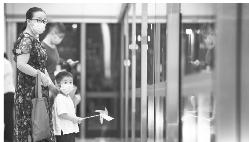
郑州地铁首批3条线路恢复载客运营 9月12日,市民在郑州地铁1号线郑大科技园站等待乘车。当日,郑州地铁首批3条线路——郑州地铁1号线、2号线一期(刘庄站至南四环站)、城郊线恢复载客运营。按照要求,市民乘坐地铁须全程佩戴口罩、核验健康码、配合工作人员进行体温测量。

据了解,活动将遴选推介主题阅读、公共服务、社会推广、数字传播、组织协调等五类全民阅读项目。据悉,国家新闻出版署将组织专家对申报项目进行评审,对入选项目进行资助,同时对入选项目加大宣传推广,充分发挥其示范作用。