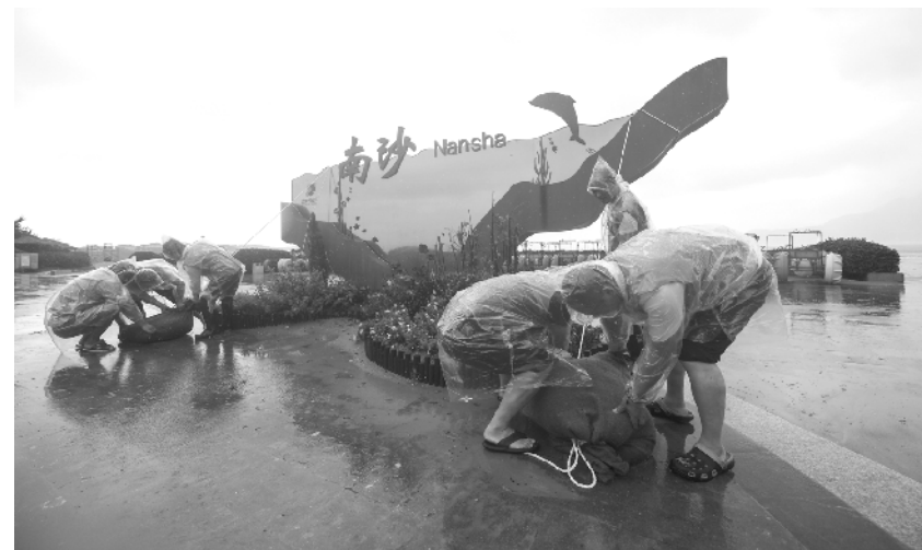
浙江积极应对台风过境影响 9月14日,党员志愿者在舟山朱家尖南沙景区内用沙袋加固景区主题墙。当日,随着台风影响逐渐减弱,浙江舟山各街道乡镇的党员志愿者积极参与排涝除险、交通疏导、清理垃圾等工作,将台风带来的影响降到最低,尽快恢复正常的工作生活秩序。

中国对外贸易中心主任储士家介绍,本届广交会展期虽然由三期缩短为一期,但将呈现更加优质的品牌展、精品展。线下有7500家企业参展,就规模而言,仍然是疫情下全世界最大规模的线下展会。设品牌展位1700个,占线下展位总数的61%,2200多家品牌企业参展,优质企业占比跟历届广交会相比显著提升。线上更新上传的展品总量超过300万件,大量新品上线。