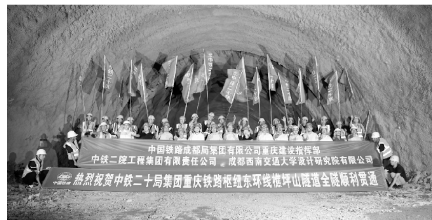
重庆铁路枢纽东环线最长隧道顺利贯通 9月14日,建设工人和工作人员在樵坪山隧道贯通而庆祝隧道贯通。当日,由中铁二院勘察院设计、中铁二十局承建的樵坪山隧道顺利贯通。该隧道正线上跨渝湘高铁,全长7568米,是重庆铁路枢纽东环线最长的双线隧道。新华社记者 唐奕 摄

《国家相册》栏目依托新华社中国照片档案馆丰富的馆藏历史照片创办,通过珍贵影像、视觉特效和人文讲述,引领观众重温家国记忆,以史为鉴,收获启迪。栏目从2016年9月开播以来,每周五与观众见面,目前播出了四季、两百多期节目,内容涵盖历史、民生、文化、科技等多个领域,全网总浏览量超过30亿次。